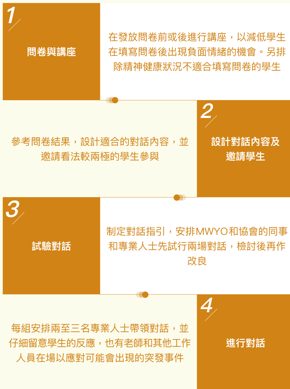
圖2.1：問卷與對話的流程