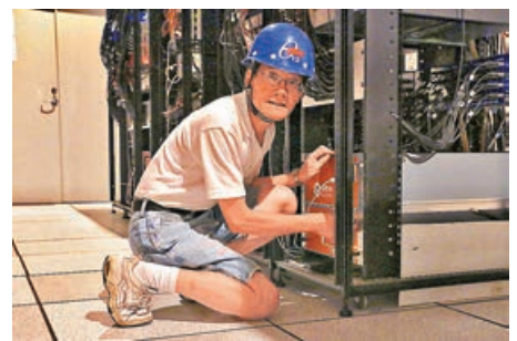
■ 陸錦標教授攝於大亞灣反應堆中微子實驗。

的大亞灣中微子振盪實驗及相關粒子物理發現成果，共同獲頒 2019 年度的物質科學獎。而陸錦標亦成為繼「無創產檢之父」盧煜明後，第二位獲「未來科學大獎」的港產科學家。